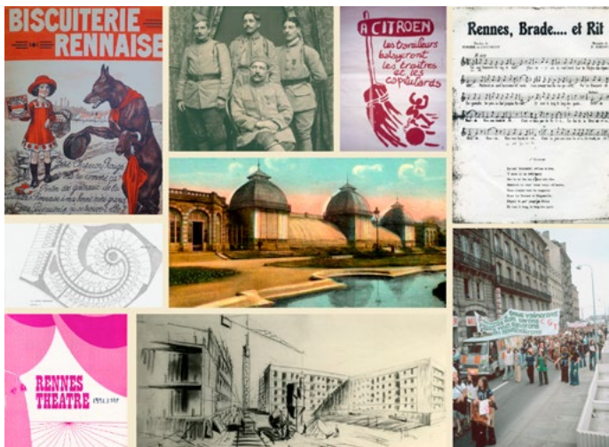
Montage composé de différentes archives privées conservées aux Archives de Rennes.

Venez découvrir ces fonds méconnus, dont de nombreux originaux inédits seront visibles pour l'occasion !